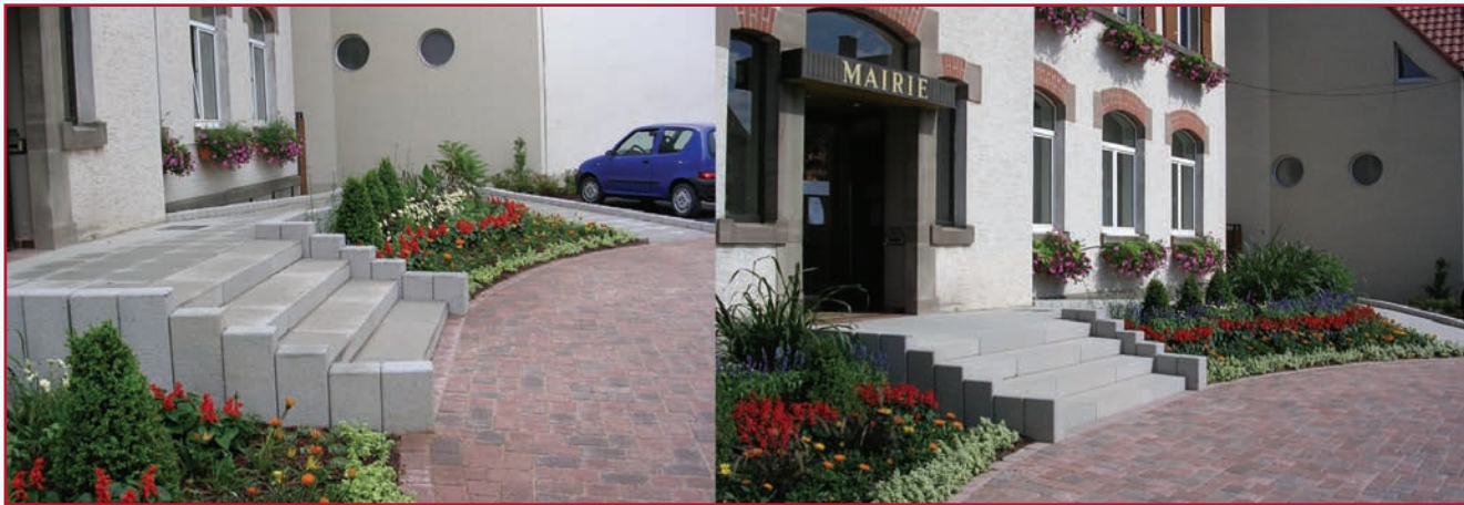
Rampe accessibilité pour personnes à mobilité réduite