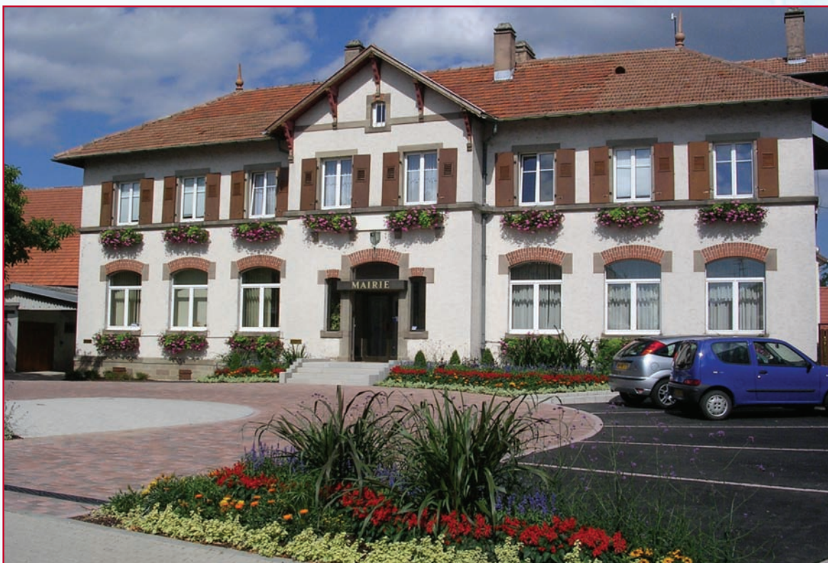
Vue générale à l'achèvement des travaux après plantation et fleurissement