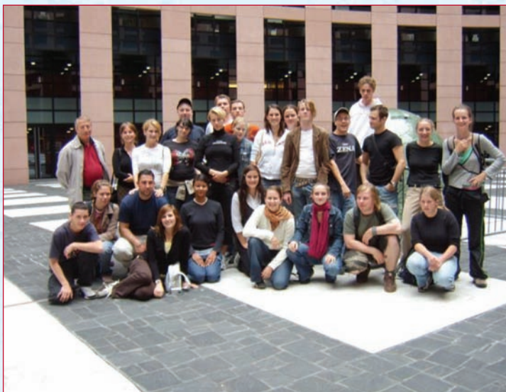
Brillat Savarin - septembre 2006

L'association, créée en 1988, est un réseau européen de développement des formations professionnelles, entre des établissements d'enseignement professionnels et techniques d'Alsace, d'Allemagne, de Suisse et d'Italie avec des entreprises pour les échanges de savoir-faire et de citoyenneté européenne.