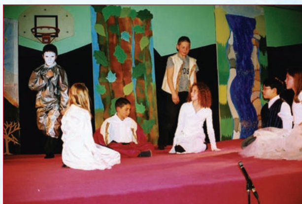
Les enfants jouant : les noces de Figaro, Don Giovanni, Mozart et Constances et Così Van Tuti