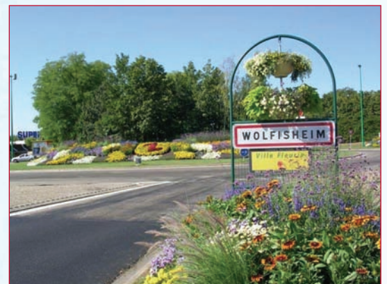
La commission " fleurissement "