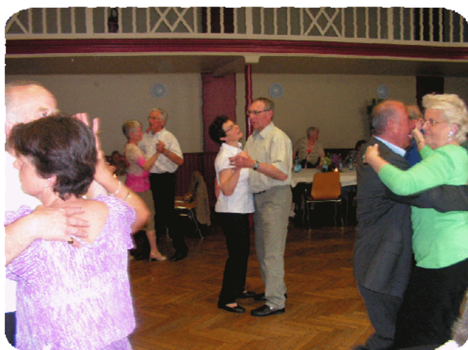
Thé dansant du dimanche 26 avril, au Soleil à Eckbolsheim

Les centres Communaux d'Action Sociale d'Eckbolsheim et de Wolfisheim organisent régulièrement des théés dansants se déroulant alternativement à la salle des fêtes d'Eckbolsheim ou à la salle polyvalente de Wolfisheim.